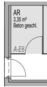
KG TOP E6